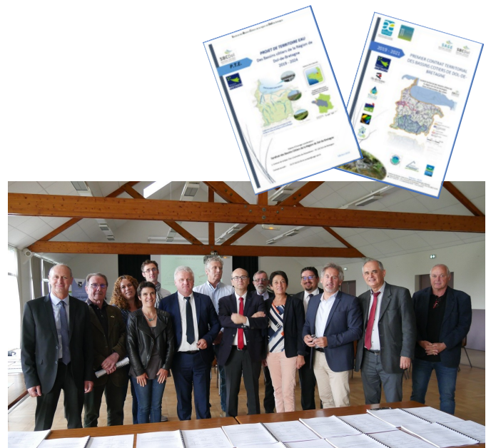
Signature officielle du Projet de Territoire Eau et du Contrat Territorial à Epiniac le 14 juin 2020